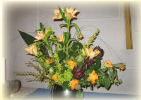
Dekoration på alteret