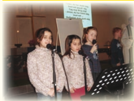
Børnesangere ved en spaghetti-gudstjeneste.

Rigtig mange børnefamilier kommer til Spaghetti-gudstjenesterne. Din familie er også velkommen. Menuen er kødsovs og spaghetti, men frem over vil der være flutes til dem, der ikke kan lide spa-