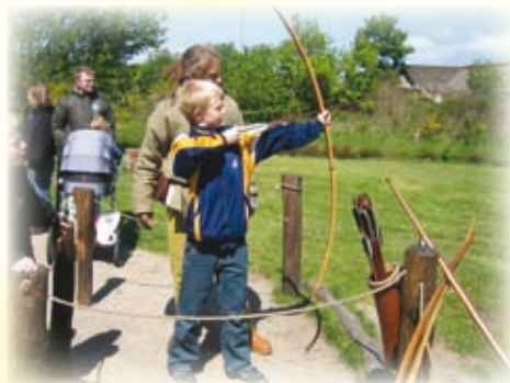
Fra sidste års udflugt.

Der bliver en familieudflugt i private biler Kristi Himmelfarts dag efter gudstjenesten kl. 10.30. Særskilt program vil blive fremlagt i kirken og udsendt på kirkens e-mail-nyheder.