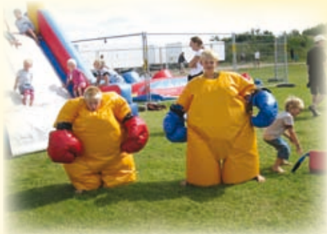
Fra sidste års sommerOase