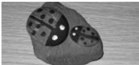
Et par forstenede mariehøns

Pirat-jagt - stafetløb med vand - rundbold - vikingespil - lamper til fyrfadslys - stenmaling - bading af snobrød i regnvejre ... det er nogle af de ting, som børn morede sig med ved Kvaglund Kirke i fire dage i juli. Hver dag var der mellem 20 og 35 børn i alderen 6 - 12 år. Sommerferien kan være lang, og vi tilbød børnene, at de