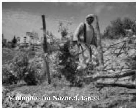
Vinbonde fra Nazaret, Israel

Fredag den 19. november er lige før advent, så det kommer aftenen til at bære præg af.